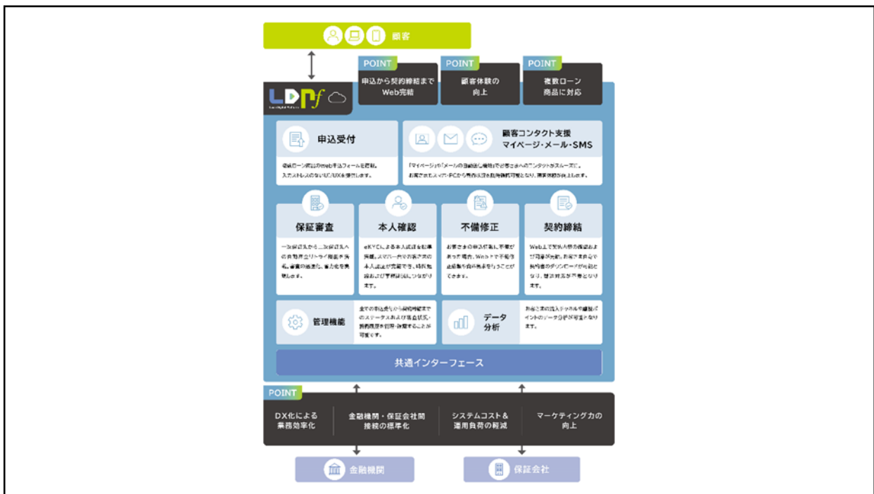
【図 1】 サービスの全体イメージ

SMB C C F および N T T データは、「データ分析・販促改善」として、申込フォームの離脱ポイント等の定量データや増額可能顧客リストを提供することにより継続的な UI/UX 改善および成約率向上へ寄与いたします。